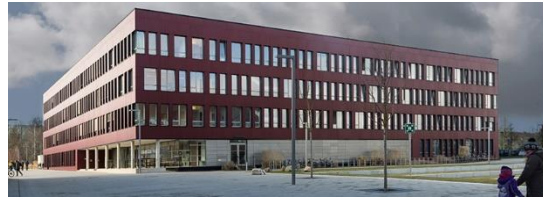
Albert-Einstein-Str. 22, Hörsaal 037

Tagungsort: Konrad-Zuse-Haus, Institut für Informatik